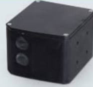
Renk Fotoseli Color Photocell